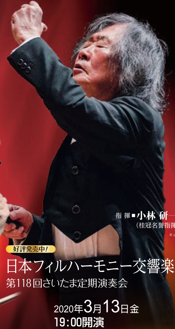
指揮 ■ 小林 研一郎 (桂冠名誉指揮者)