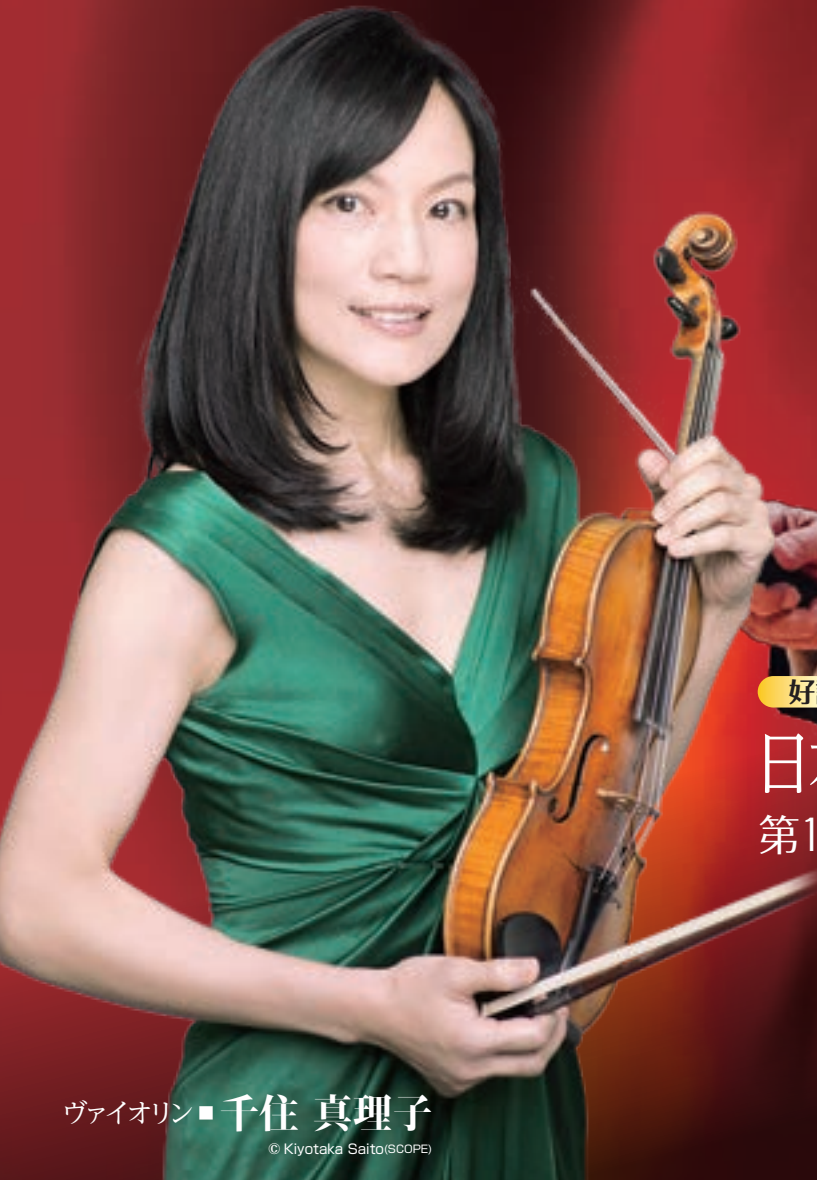
ヴァイオリン ■ 千住 真理子