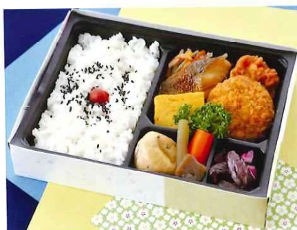
G-7 和風メンチカツ弁当 21×16 税込価格 1,100 円 (税抜価格 1,000 円)