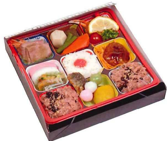
SS-70 ソニックシティ弁当 「令和」 (ビューティフルハーモニー) 2,062円(税込) 1,875円(税抜)