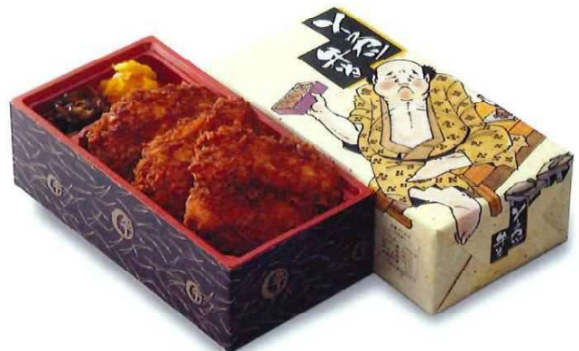
[T-4] ソースかつ弁当 1,019円