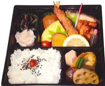
SS-71 幕の内弁当 1,375円(税込) 1,250円(税抜)