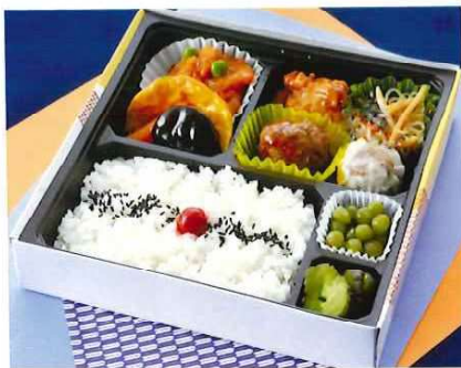
G-4 中華幕の内弁当 21×21 税込価格 1,320 円 (税抜価格 1,200 円)