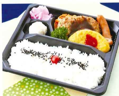
G-10 洋風弁当 23×20 税込価格 880 円 (税抜価格 800 円)