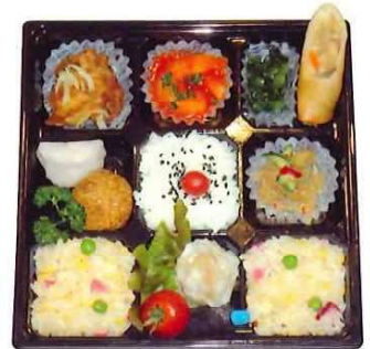
SS-69 ソニックシティ弁当 (中華) 1,492円(税込) 1,356円(税抜)