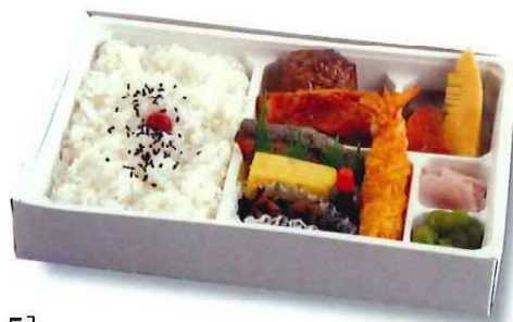
[T-5] 幕の内弁当 866円 ご飯・マス塩焼・煮物・若鶏照焼 エビフライ・厚焼玉子・肉だんご うぐいす豆・ヒジキ煮・漬物