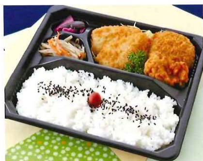
G-9 ミックスフライ弁当 23×20 税込価格 880 円 (税抜価格 800 円)