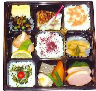
SS-67 ソニックシティ弁当 (和風) 1,492円(税込) 1,356円(税抜)