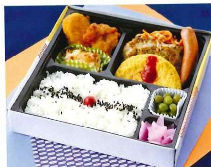
G-5 洋風幕の内弁当 21×21 税込価格 1,320 円 (税抜価格 1,200 円)