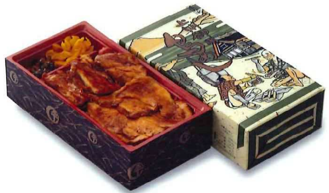
[T-2] 上州御用 鳥めし松弁当 1,019円