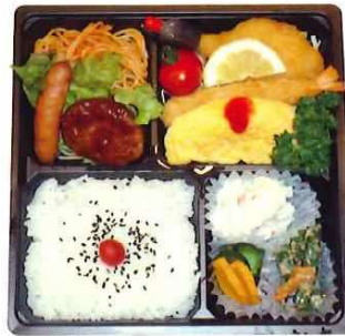
SS-68 ソニックシティ弁当 (洋風) 1,492円(税込) 1,356円(税抜)