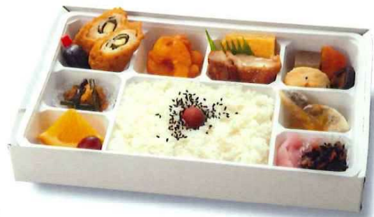
[T-6] 幕の内弁当 1,324円 ご飯・チキンチーズ大葉巻・煮物 アサリの佃煮・若鶏照焼・エビチリ 鱈甘酢あんかけ・厚焼玉子・ヒジキ煮 フルーツ(ブドウ・オレンジ)・漬物