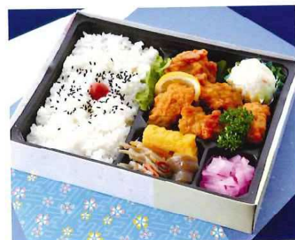
G-8 唐揚弁当 21×16 税込価格 990 円 (税抜価格 900 円)