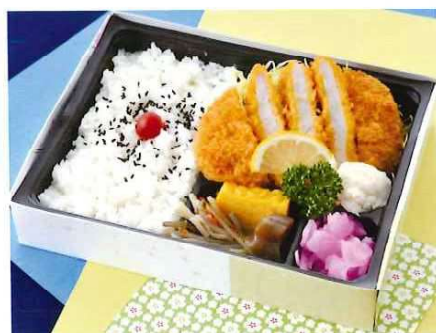
G-6 とんかつ弁当 21×16 税込価格 1,100 円 (税抜価格 1,000 円)