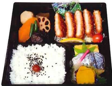
SS-72 とんかつ弁当 1,237円(税込) 1,125円(税抜)