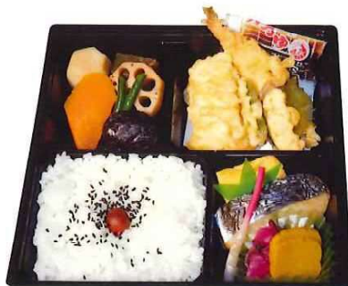
SS-73 天ぷら弁当 1,237円(税込) 1,125円(税抜)