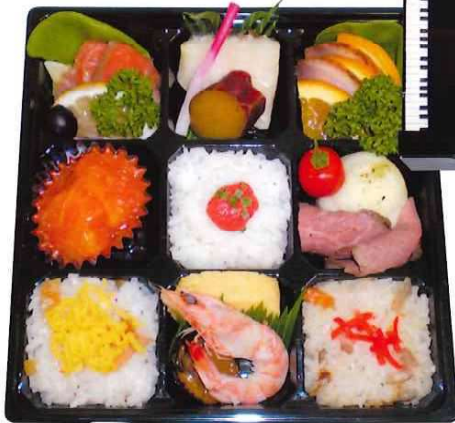
SS-00 ソニックシティ弁当 (ハーモニー) 1,787円(税込) 1,625円(税抜)