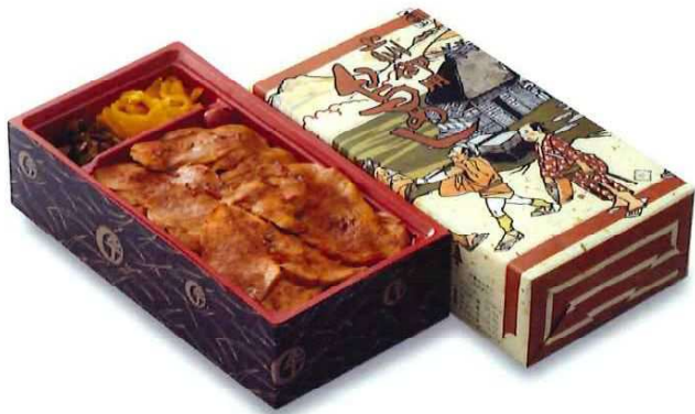
[T-1] 上州御用 鳥めし竹弁当 866円