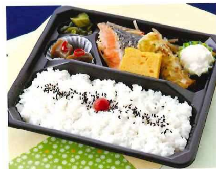
G-11 和風弁当 23×20 税込価格 880 円 (税抜価格 800 円)