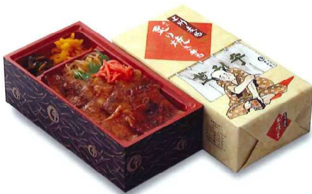
[T-3] 上州麦豚 炙り焼き弁当 1,019円